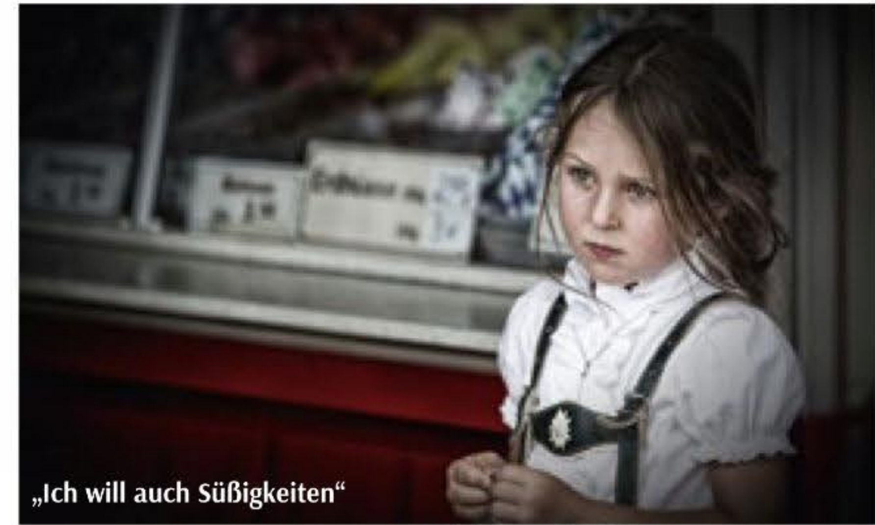
„Ich will auch Süßigkeiten“

Angefangen hat er Anfang der 1990er-Jahre mit Reisefotografien, die er mit seiner ersten Spiegelreflexkamera geschossen hat. Er fotografierte in Asien, Australien,