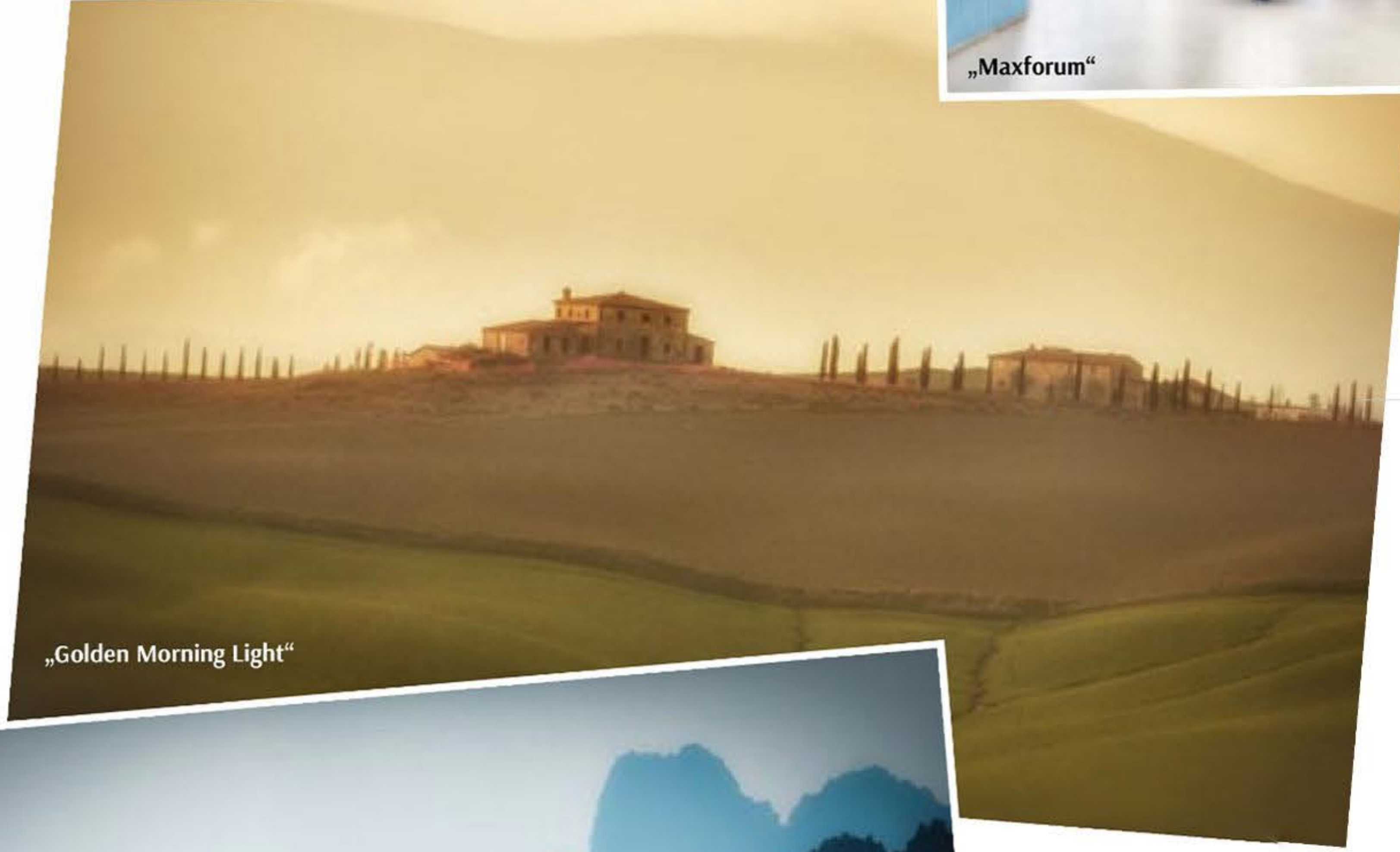
„Golden Morning Light“